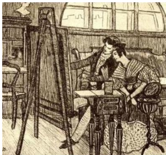
Мечты художника Пискарева.