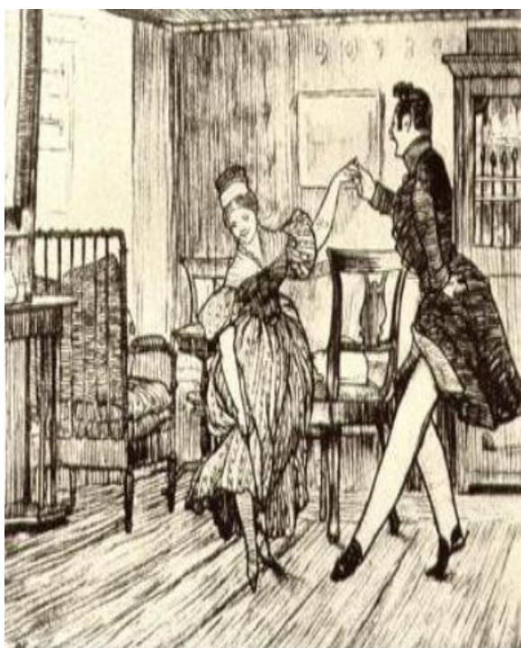
Пирогов и блондинка.